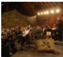
Die Scheune von Gut Roß verwandelten die...