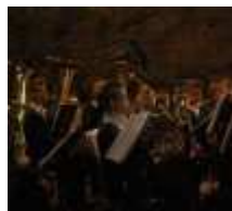
Die Scheune von Gut Roß verwandelten die...